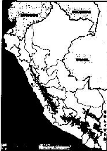
NIVELES DE PELIGRO